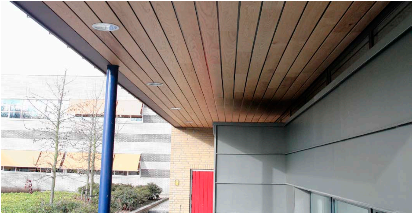
Het buitenplafond is afkomstig van Derako en Versleeuwen is verantwoordelijk voor het nieuwe exterieur.